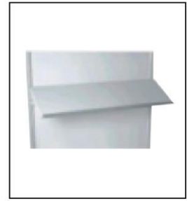
1005 斜层板 Sloped Shelf