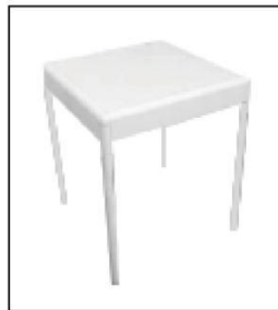
1011 方桌 Square Table