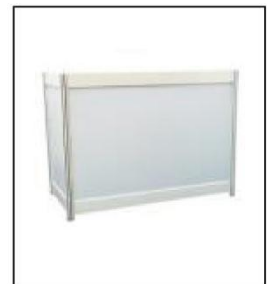
1009 问询桌 Information Counter