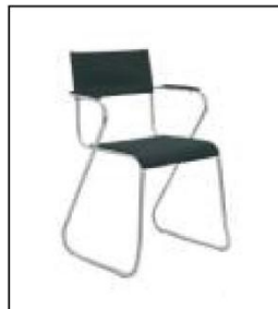
1015 轻便皮椅 Light Leather Chair