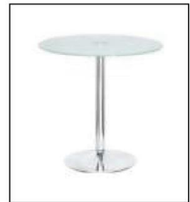
1013 玻璃圆桌 Glass Round Table