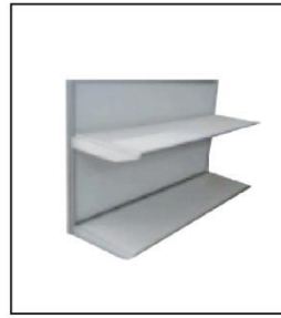
1004 平层板 Flat Shelf