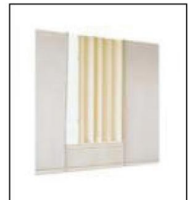
1017 折门 (带锁) Folding Door