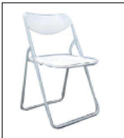
1014 折椅 Folding Chair