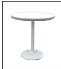
1012 木制圆桌 Wooden Round Table