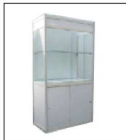
1007 玻璃高柜 (无灯) Tall Glass Showcase