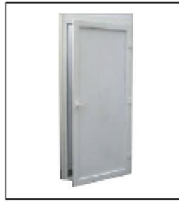
1003 铝平开门 (带锁) Lockable Door