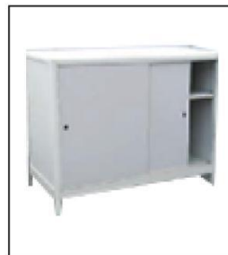
1008 带锁柜 Lockable Cupboard