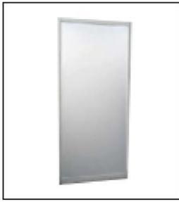
1002 墙板 Wallboard