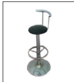
1016 吧凳 Bar Stool