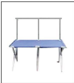
1010 长方折叠桌 Rectangular Folding Table