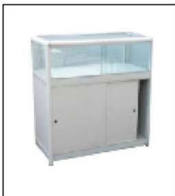
1006 玻璃平柜 (无灯) Low Glass Showcase